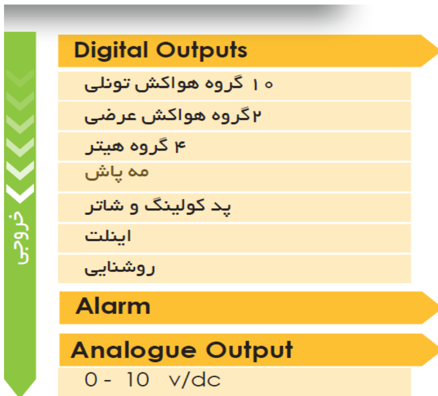
۲/۴ ویژگی‌ها و کاربردهای محصول