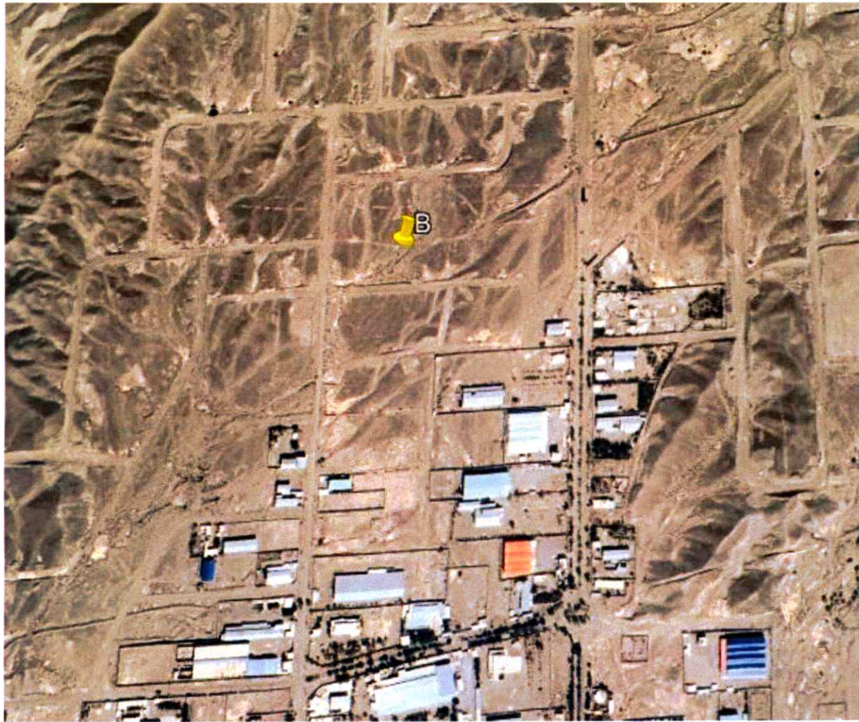
تصویر ۳- زمین محل احداث کارخانه در شهرک صنعتی ایرانشهر